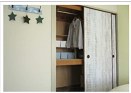
クローゼット化 (ハンガーパイプ設置)