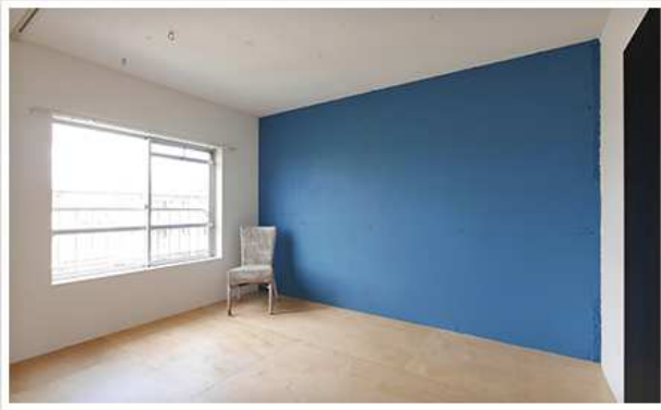
壁の塗装替え・クロス替え