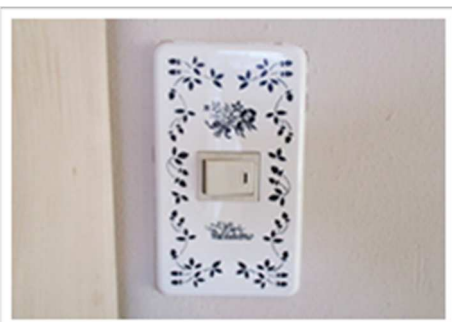
スイッチプレートの取替え