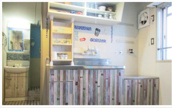
流し台・吊戸棚・棚